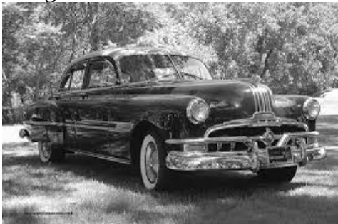
( Pontiac Sedan – 52).

En parkeringsvagt kørte bilen frem, og den yngste satte sig bag rattet og gjorde tegn til, at jeg skulle sætte mig ved siden af ham. Den anden ledsager satte sig ligeledes ind til os på forsædet. Vognen var en firedørs sort Pontiac Sedan.