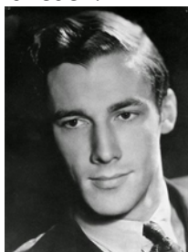
Desmond Leslie (1921-2001)

Læs derfor den følgende beretning med et åbent sind, og se, om ikke denne lære indebærer sandheden.