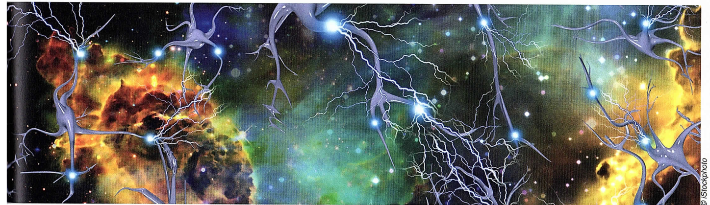
Hvert enkelt menneske er en hjerne-/nervecelle i Klodevæsenets nervesystem. Din udvikling og Klodens udvikling er to sider af samme sag.